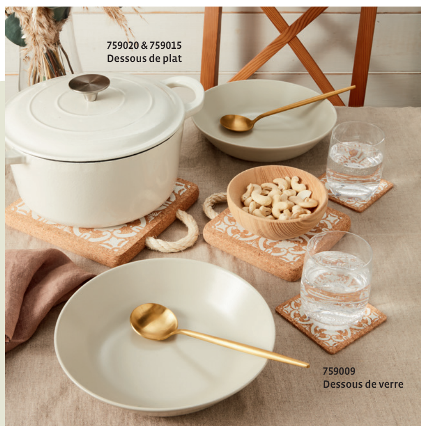
759020 & 759015 Dessous de plat

Nous nous réjouissons de la saison 2026 et de vos commentaires lors des prochains salons. Vous trouverez la liste de nos dates de salons au verso !