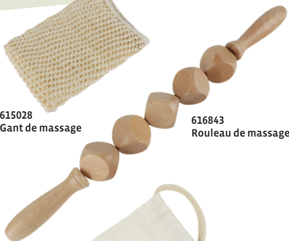
616843 Rouleau de massage