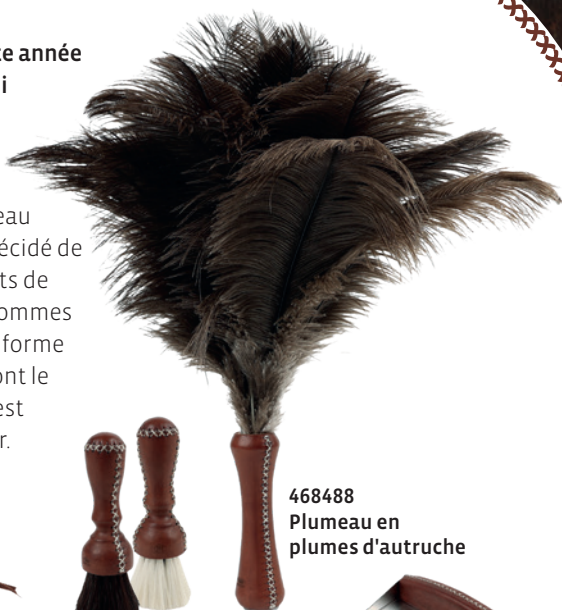
468488 Plumeau en plumes d'autruche