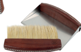
428473 Set ramasse-miettes