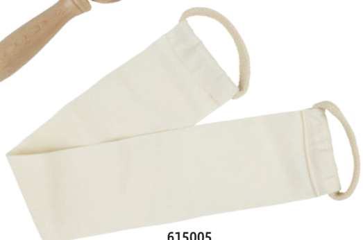
615005 Ceinture d'exfoliation/massage