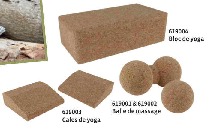
619004 Bloc de yoga

Les grimpeurs nous ont souvent demandé une brosse pour bloc. Le problème : les résidus de magnésium incrustés autour des prises de bloc. Nous