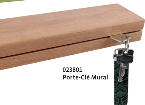
023801 Porte-Clé Mural

Les nettoyeurs d'anneaux (257013 et 257011) en acier inoxydable de haute qualité permettent d'éliminer sans effort les résidus et les traces de brûlé des ustensiles de cuisine en fonte ou en fer forgé sans endommager la précieuse patine.