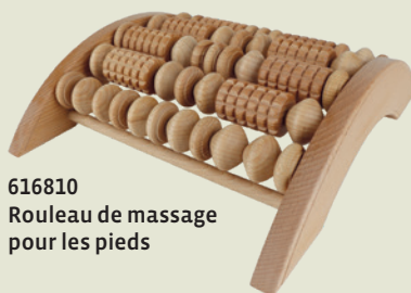
616810 Rouleau de massage pour les pieds

Le matériau : le bois est chaud et ferme et permet de masser intensément certaines zones spécifiques. Exemples : rouleaux de massage ou bois GuaSha. Les brosses en fibres naturelles ou les sangles, comme notre nouvelle sangle de massage, complètent le massage par un effet exfoliant et stimulent particulièrement la circulation sanguine – merveilleux après un bain ou pendant une séance de sauna.