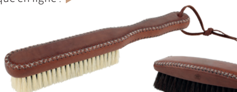
448410 Brosse pour le cachemire

Le bois est un matériau naturel merveilleux qui, non seulement remplit sa fonction pendant des décennies, mais devient aussi de plus en plus beau avec le temps. Il en va de même pour le cuir. C'est pourquoi nous avons décidé de combiner ces deux matériaux. Nous avons habillé nos plus beaux produits de revêtements en cuir fabriqués à la main par une petite manufacture et sommes ravis du résultat. Le cuir cousu main avec des coutures décoratives transforme nos belles brosses en cadeaux uniques et en objets de collection qui feront le bonheur de leurs propriétaires pendant des décennies. Chaque produit est unique, avec son propre caractère, son propre look et son propre toucher. Enfin et surtout : un véritable accroche-regard dans la vitrine ou sur la page d'accueil de la boutique en ligne ! ▶