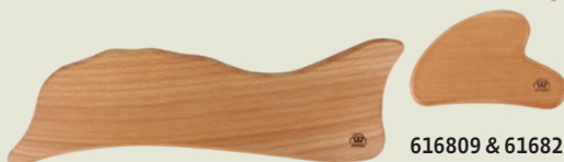
616809 & 616825 Bois de massage GuaSha