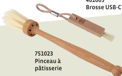
461005 Brosse USB-C

Notre thème dans le nouveau catalogue est « Conçu... pour la vie ». Toutes les nouveautés suivent cette devise. Mais nous ne serions pas Redecker si nous n'attribuions pas toujours une fonction à un bon design. C'est pourquoi nous avons conçu des objets design qui facilitent étonnamment la vie : le panneau à clés sans crochets, par exemple : une astuce simple mais ingénieuse, sans fixations visibles.