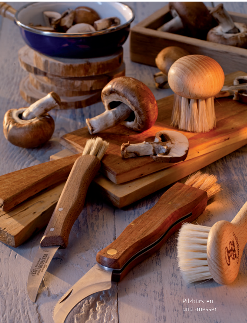
Pilzbürsten und -messer