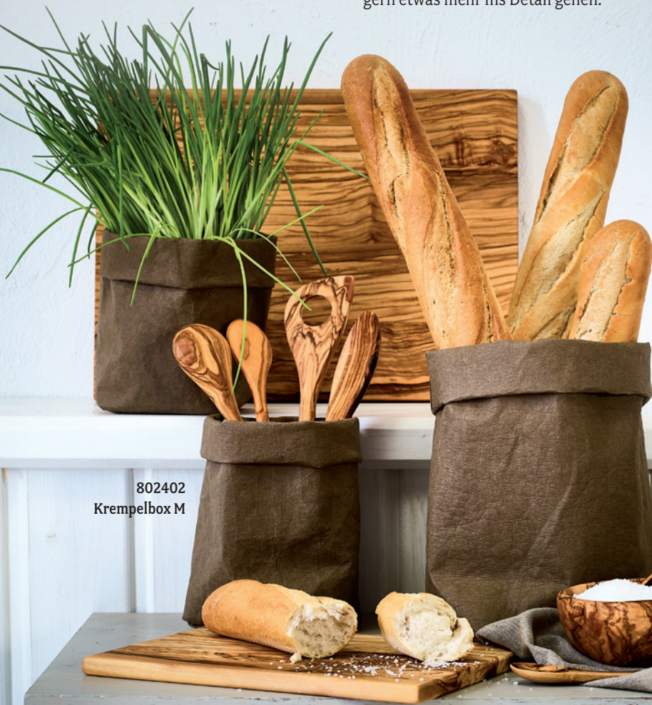
802402 Krempelbox M

Unsere neuen Krempelboxen sind ideal für alles, was eine schnelle und schöne Aufbewahrung und Präsentation benötigt: Baguette, Brötchen und Brotscheiben bei Tisch, Küchen- oder Schreibutensilien, Übertopf für Kräuterpflanzen ... Hauptbestandteil ist Cellulose und sie sind sogar bei 30°C waschbar! ▶