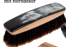
760316 Luxus-Glanzbürste mit Horndekor