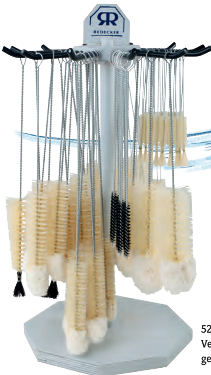
520012 Verkaufsständer für gedrehte Bürsten