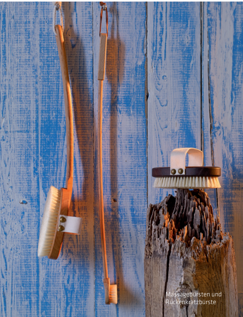
Massagebürsten und Rückenkratzbürste