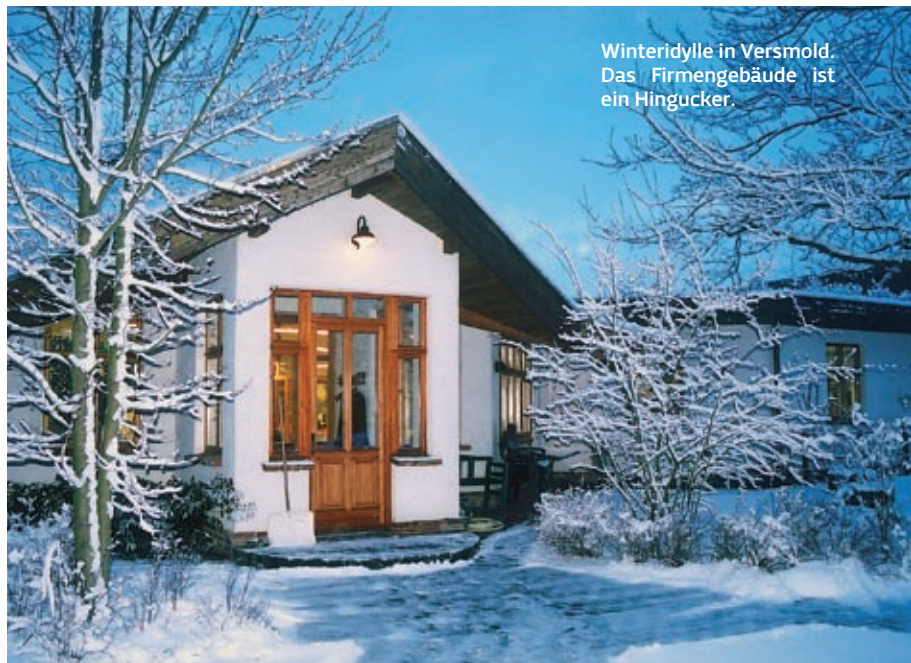
Winteridylle in Verasmold. Das Firmengebäude ist ein Hingucker.

Die 80er und 90er Jahre brachten Kataloge, die Ausweitung des Sortiments und – immer wichtiger – die Konzentration auf die Eigenentwicklung neuer Produkte. Längst waren die klassischen