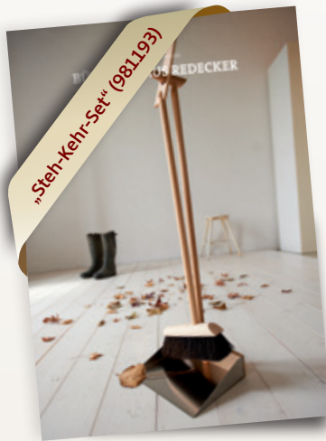
Ganz neu: Wunderschöne Plakate für die Redecker-Präsentation