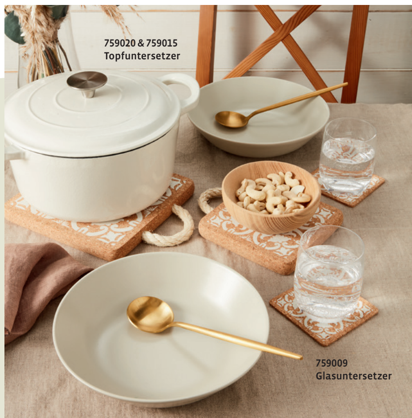
759020 & 759015 Topfuntersetzer

Wir freuen uns auf die Saison 2026 und Ihr Feedback auf den kommenden Messen. Eine Liste mit unseren Messeterminen finden Sie auf der Rückseite!