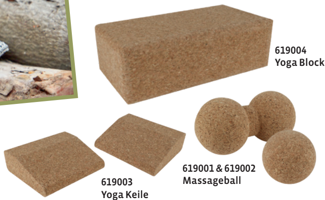
619004 Yoga Block

Nach einer Boulderbürste sind wir von Kletterern oft gefragt worden. Das Problem: Festsitzende Chalkreste rund um die Bouldergriffe. Jetzt haben