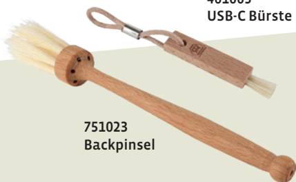
461005 USB-C Bürste

Überhaupt ist unser Thema im neuen Katalog: Designed ... fürs Leben. Alle Neuheiten folgen diesem Motto. Wir wären aber nicht Redecker, wenn wir gutem Design nicht immer einen Zweck zuordnen würden. Deshalb haben wir Designstücke entworfen, die verblüffend lebenserleichternd sind: Das Schlüsselbrett ohne Haken beispielsweise: Ein schlichter, aber genialer Trick – ohne sichtbare Befestigungen.