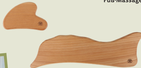
616809 & 616825 GuaSha Massageholz