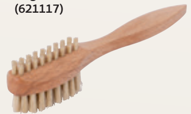
Nagelbürste mit Griff (621117)