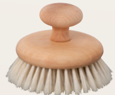
Massagebürste mit Knauf (601010)