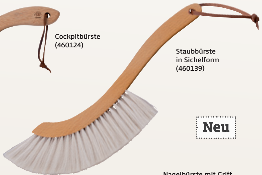
Staubbürste in Sichelform (460139)