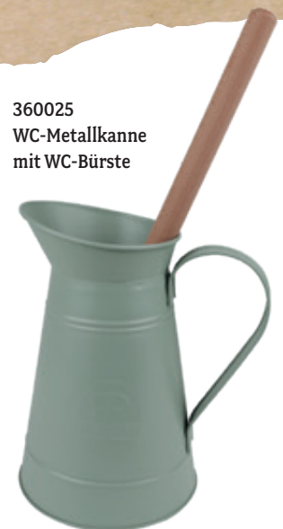
360025 WC-Metallkanne mit WC-Bürste