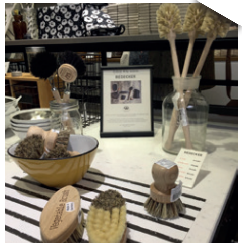
Mehr Impressionen von unserer Reise nach Seoul ...