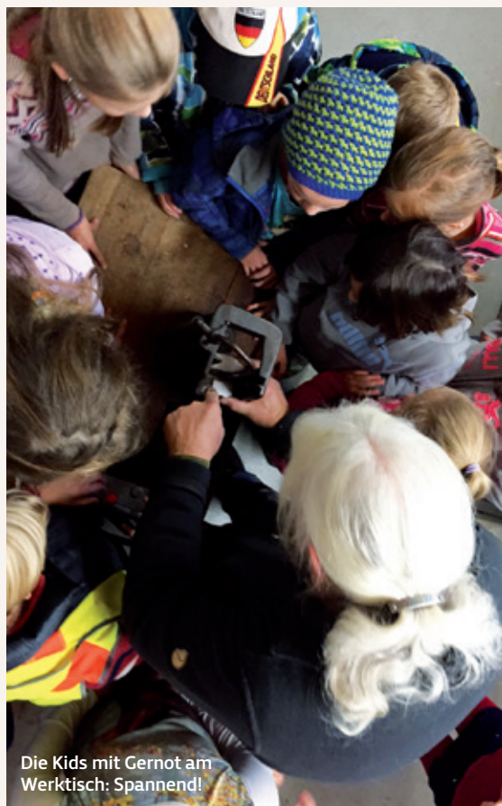
Die Kids mit Gernot am Werk Tisch: Spannend!