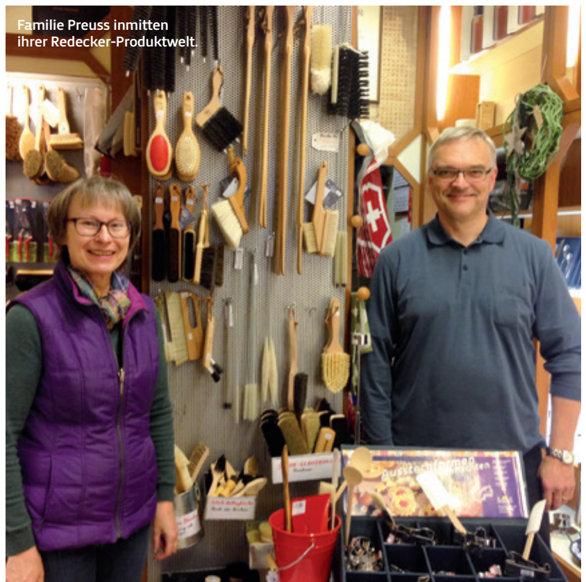
Familie Preuss inmitten ihrer Redecker-Produktwelt.

hat sich die Familie mittlerweile umorientiert: Durch einen Besuch auf unserem Messestand auf der Ambiente in Frankfurt lernte man sich kennen, fing an, über Bürsten und Haushaltswaren nachzudenken und machte eine erste